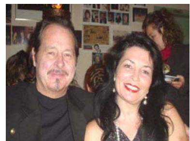
Team Seefried Gebietsleiter Karlsruhe