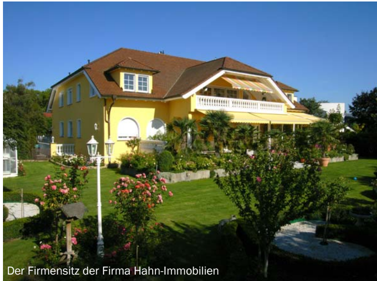
Der Firmensitz der Firma Hahn-Immobilien

Hahn-Immobilien ist seit 1983 erfolgreich am Immobilienmarkt vertreten. Durch unsere fundierte Beratung und faire Vermittlung war es uns möglich unser Einzugsgebiet in alle Bundesländer Deutschlands auszuweiten. Aufgrund der starken Vertrauensbasis unserer Kunden, sind wir in der Lage unser Angebot laufend zu erweitern. Dadurch können wir uns heute auch guten Gewissens zu einem der führenden, nationalen Immobilienprofis am deutschen Markt zählen.